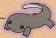
虎高のマスコットキャラクター、トラマンダラーです。

所在地 〒529-0112 滋賀県長浜市宮部町2410番地 電話 1年生担任・事務 (0749) 73-3056 FAX (0749) 73-2967 2年生担任 (0749) 73-3057 3年生担任 (0749) 73-4780 進路指導室 (0749) 73-4782 体育館 (0749) 73-4781 事務室 (0749) 73-3055 ホームページアドレス http://www.torajime-h.shiga-ec.ed.jp/